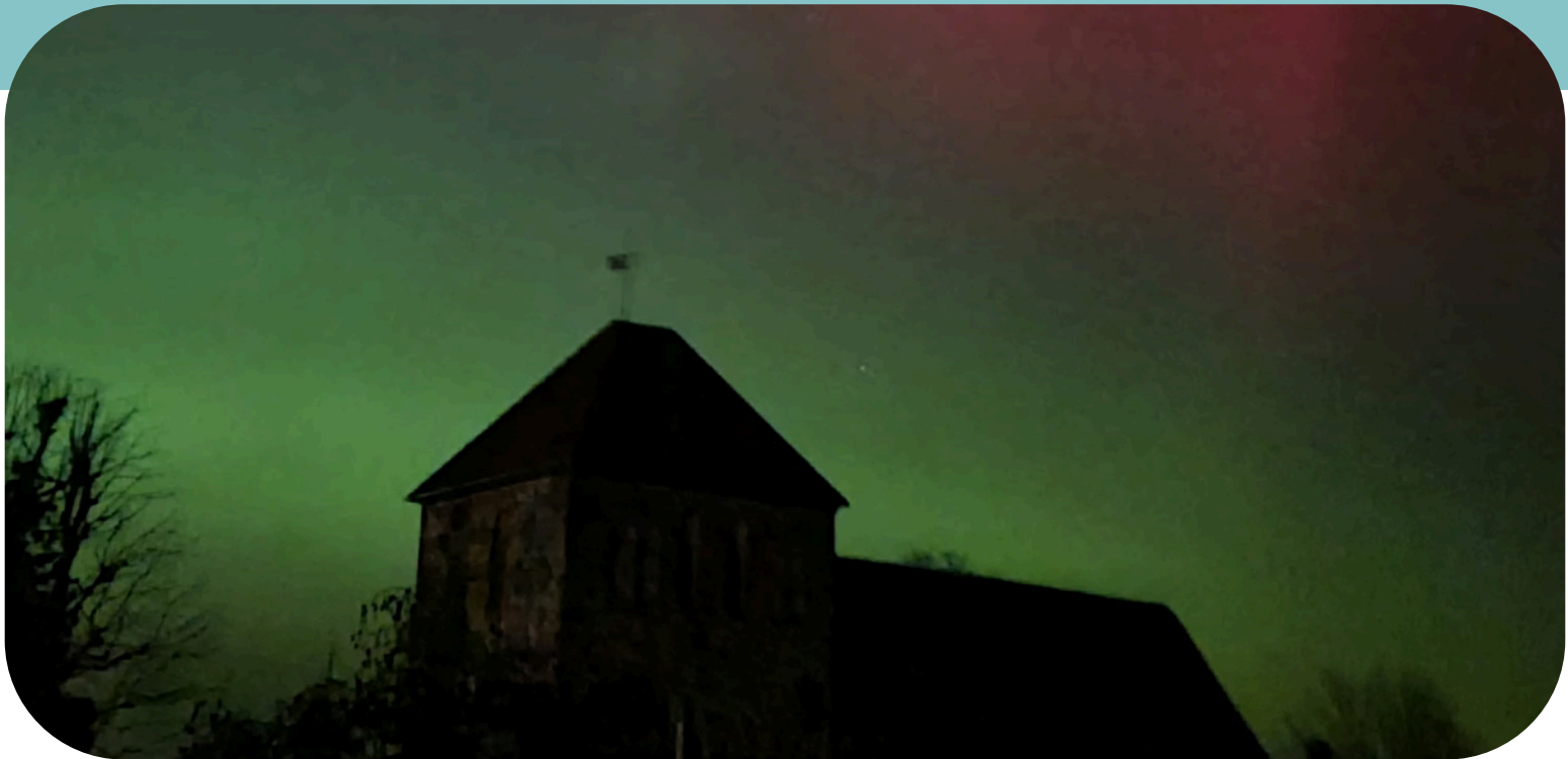
[POLARLICHTER ÜBER SLATE]